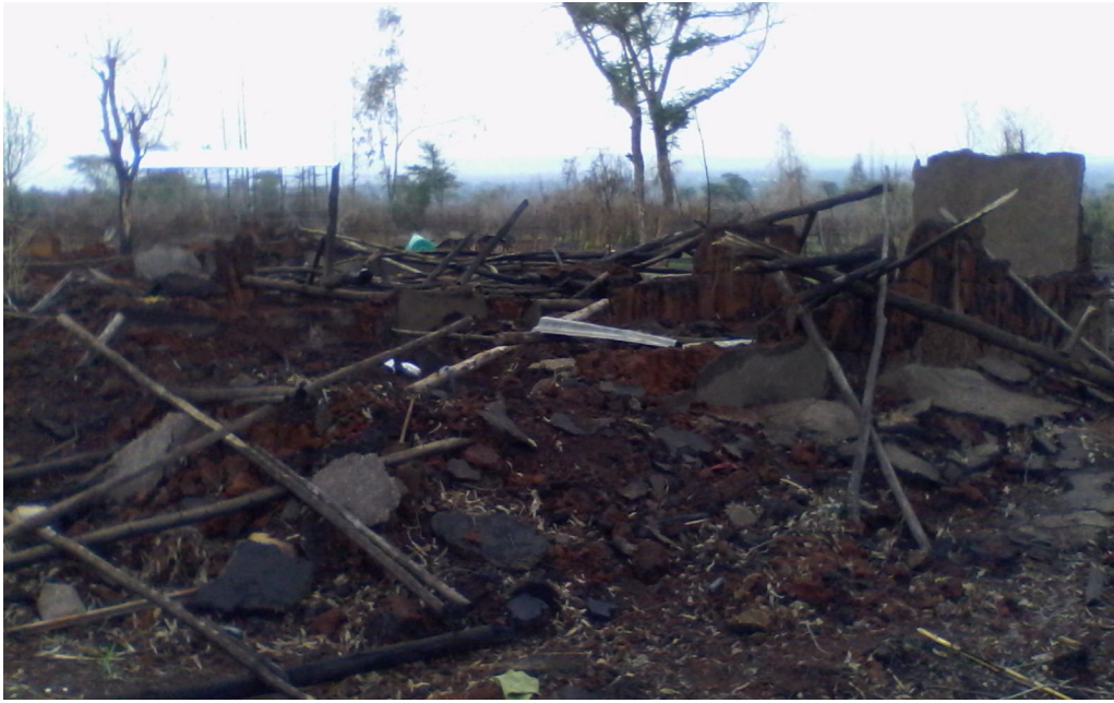
ፎቶ ግራፍ 4: በእሳት የተቃጠለ የአርሶ አደር መኖሪያ ቤት ናሙና፣ ቦታ አሮሚያ ክልል ምዕራብ ሸዋ ዞን ናኖ ወረዳ ናኖ አሎ ቀበሌ ውስጥ የተነሳ ፎቶግራፍ 2007 ዓ.ም